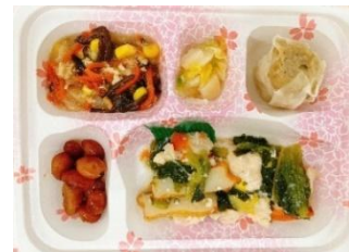
②幸たんぱく食の例