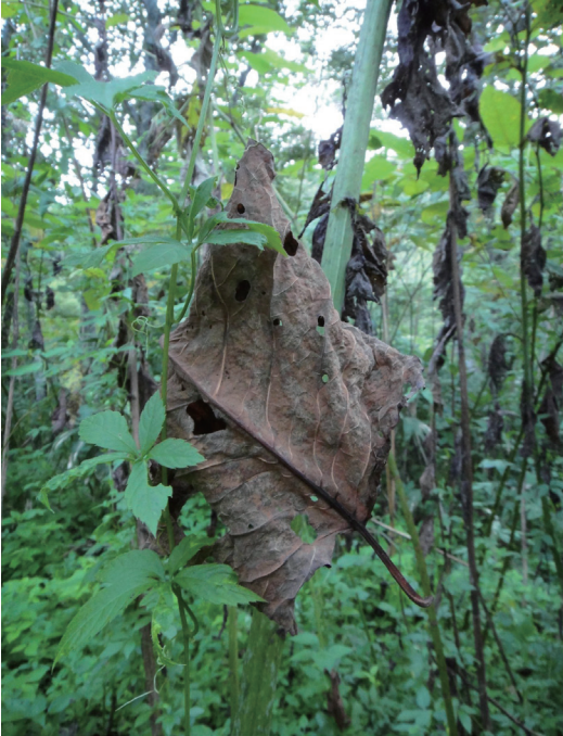
図2. コテングコウモリが利用していた「川上本流林道」のオオイタダリの枯葉。

3枚が設置された。17:30から調査を開始したが、19:30頃から降り出した雨がひどくなり、20:00には調査を中止した。18:45に林道上でBD(40kHz)の弱い反応があったのみで、それ以外の反応や捕獲はなかった。気温は20.3°C(19:30)であった。