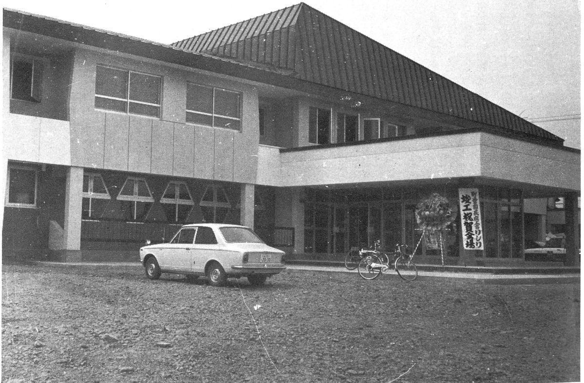
道北随一の国民宿舎「りしり」8月7日オープン