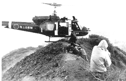
(利尻町自衛隊協力会事務局)

この写真は去る六月二十日利尻富士頂上付近で遭難した北九州市に住むH氏の陸上自衛隊ヘリコプターによる災害救助状況の写真です。