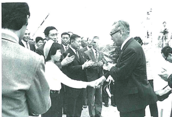
港で歓迎を受ける知事

この間視察移動中知事は各地区の住民と随所で交歓され、住民も再会の歓迎を見せおりました。