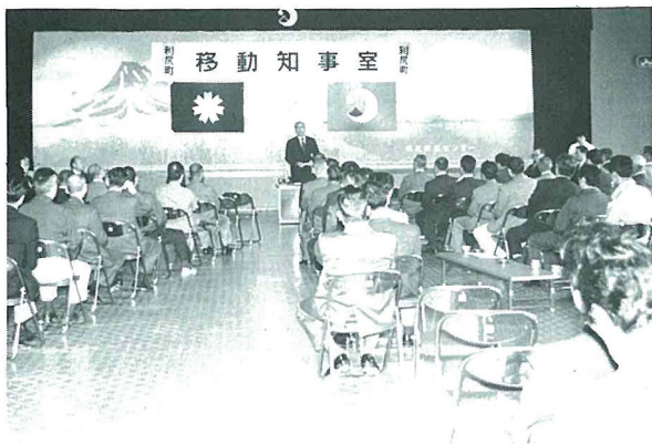
町民センターでの移動知事室