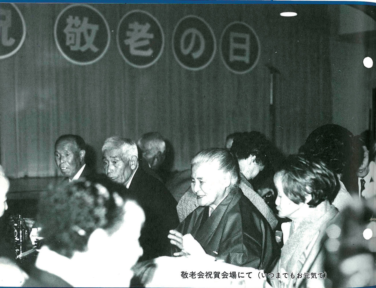
敬老会祝賀会場にて (いつまでもお元気で)