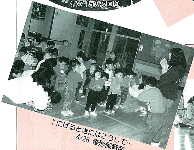
↑にげるときにはこうして... 4/28 沓形保育所