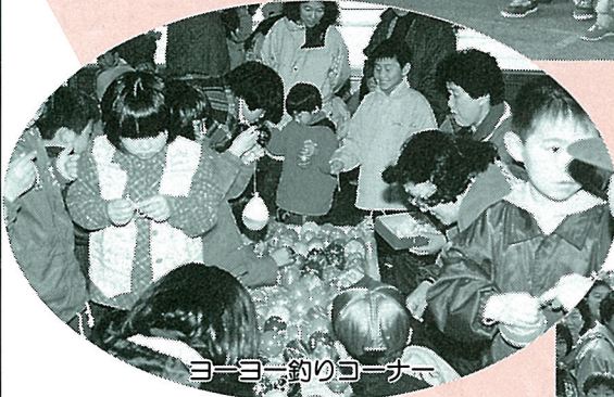
ヨーヨー釣りコーナー