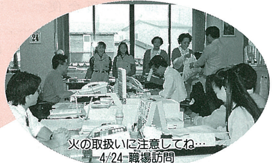
火の取扱いに注意してね... 4/24 職場訪問