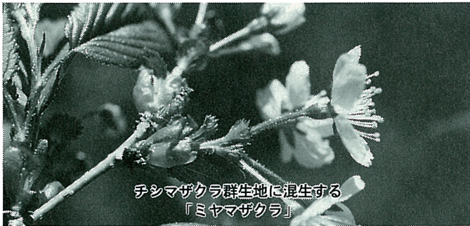
チシマザクラ群生地に混生する『ミヤマザクラ』

昨年の調査で、仙法志の大空沢上流には、チシマザクラとミヤマザクラがあることがわかりました。(詳しくは博物館だよりを読んで下さい)そこで今年にはチシマザクラが一体どれくらいあるのかを、六月十日あたりに調べにいきます。