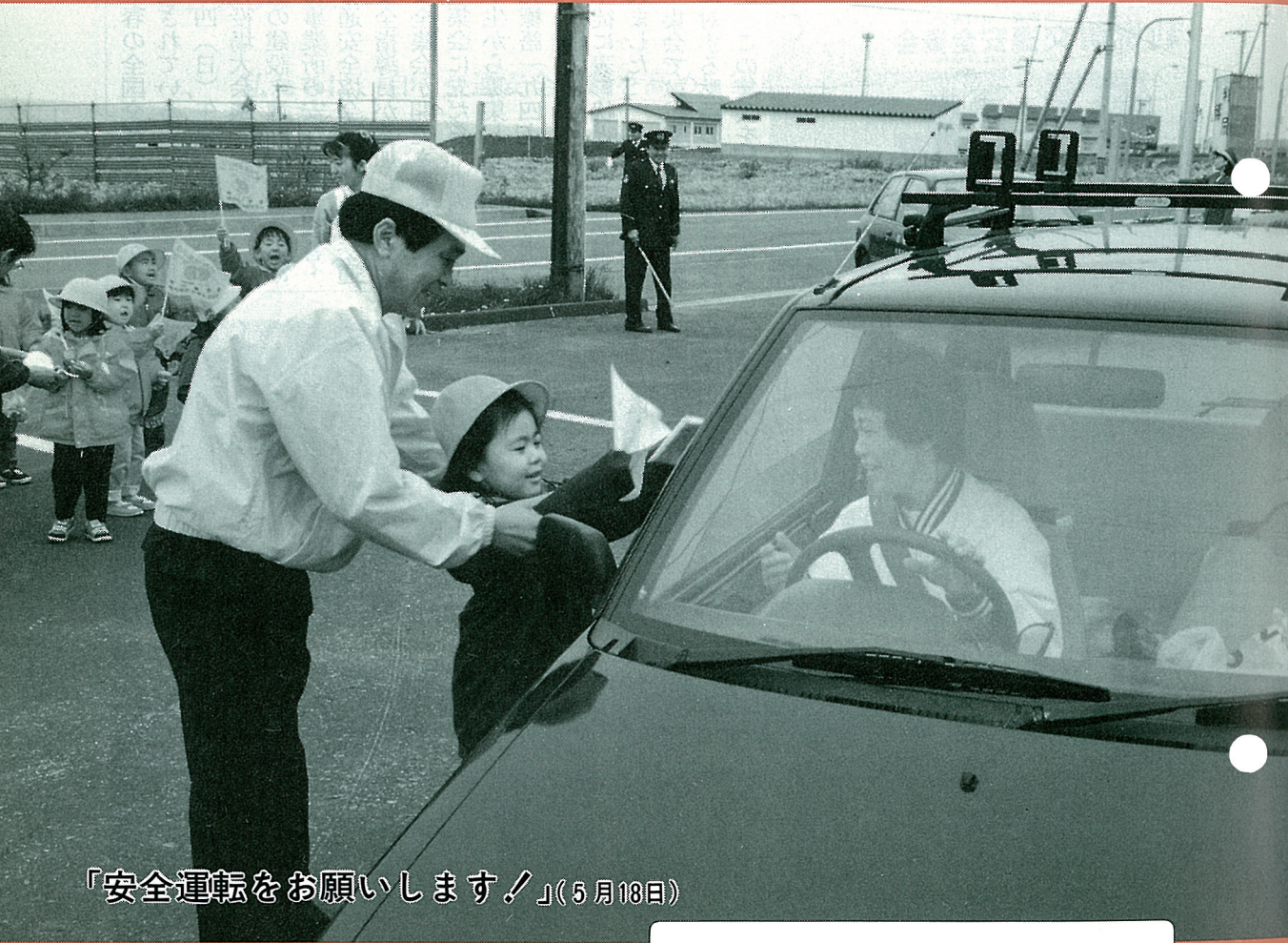
「安全運転をお願いします！」(5月18日)