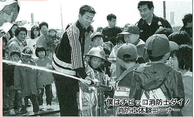
僕はチビっこ消防士ダイ！ 消防士体験コーナー