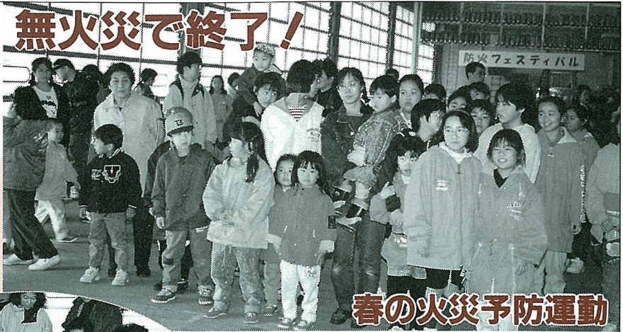
春の火災予防運動

四月二十日から十一日間 実施された春の火災予防運 動は無火災で終了しました。 利尻はこれからも空気が 乾燥し火災の発生しやすい 季節が続きます。火の取扱 いには十分注意しましょう。