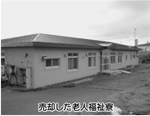
売却した老人福祉寮