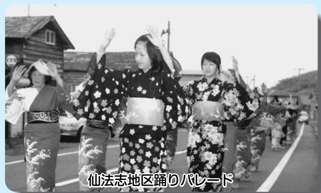
仙法志地区踊りパレード