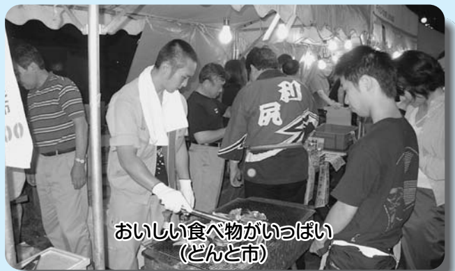
おいしい食べ物がいっぱい (どんと市)