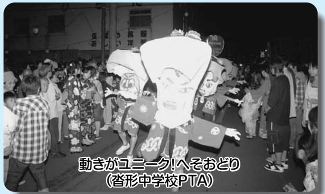
動きがユニーク!へそおどり (沓形中学校PTA)