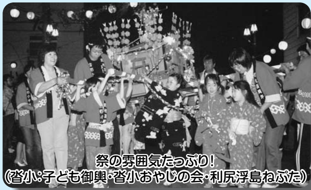
祭の勇団気たっぷり! (沓小:子ども御輿・沓小おやじの会・利尻浮島ねぶた)