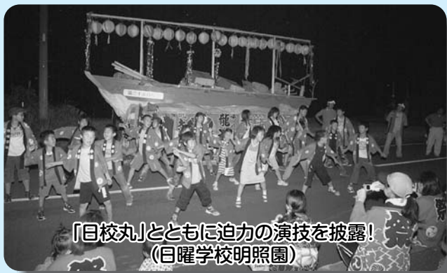
「目校丸」とともに迫力の演技を披露! (目曜学校明照園)