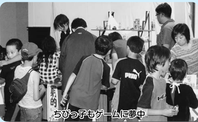
ちびっ子もゲームに夢中