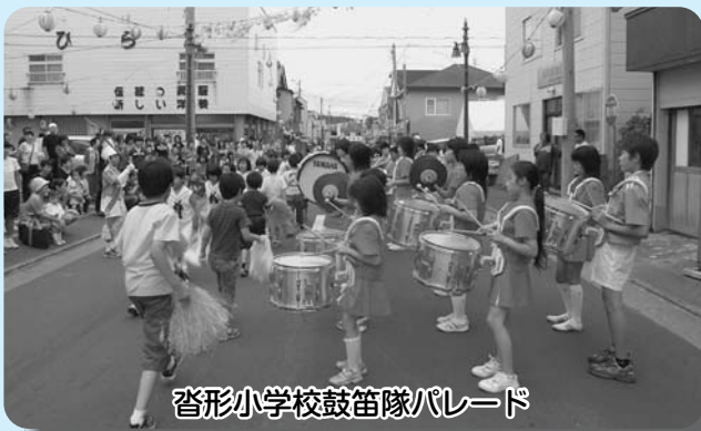
沓形小学校鼓笛隊パレード