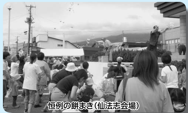
恒例の餅まき(仙法志会場)