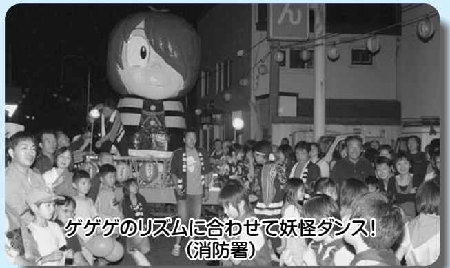
ゲゲゲのリズムに合わせて妖怪ダンス! (消防署)