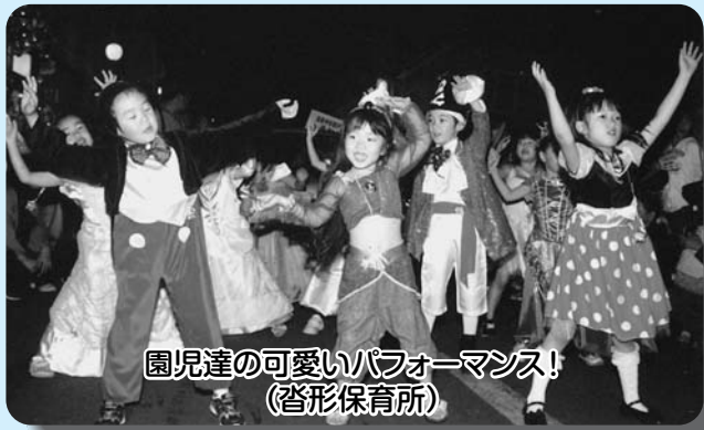
園児達の可愛いパフォーマンス! (沓形保育所)