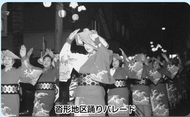
沓形地区踊りパレード