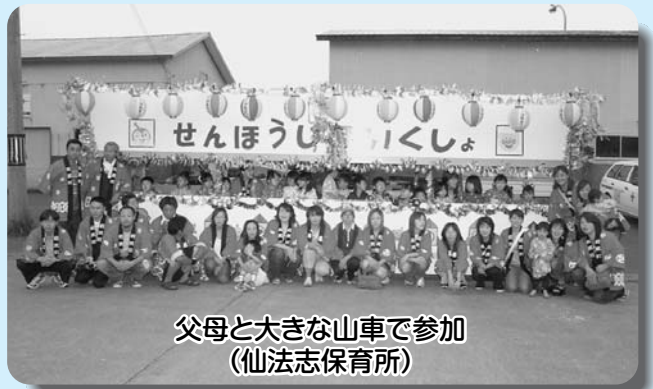
父母と大きな山車で参加 (仙法志保育所)