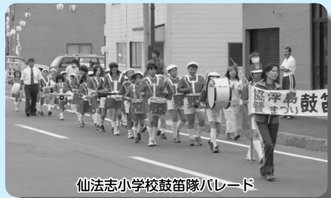
仙法志小学校鼓笛隊パレード