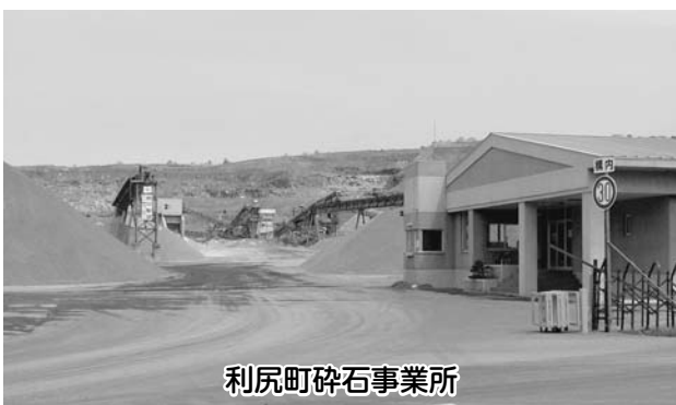
利尻町砕石事業所