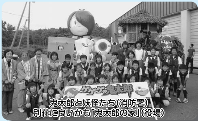
鬼太郎と妖怪たち(消防署) 別荘に良いかも「鬼太郎の家」(役場)