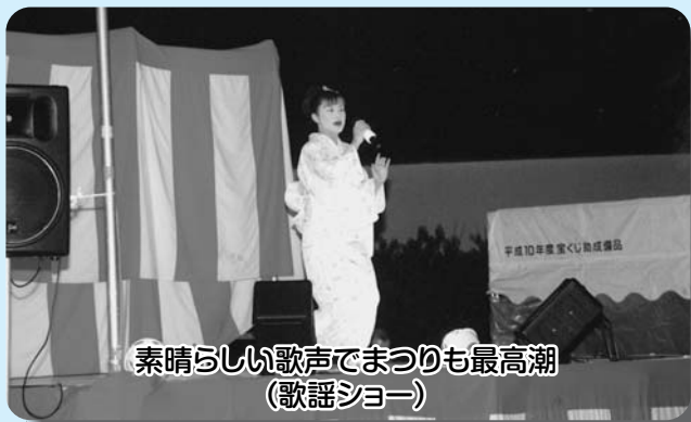
素晴らしい歌声でまつりも最高潮 (歌謡ショー)