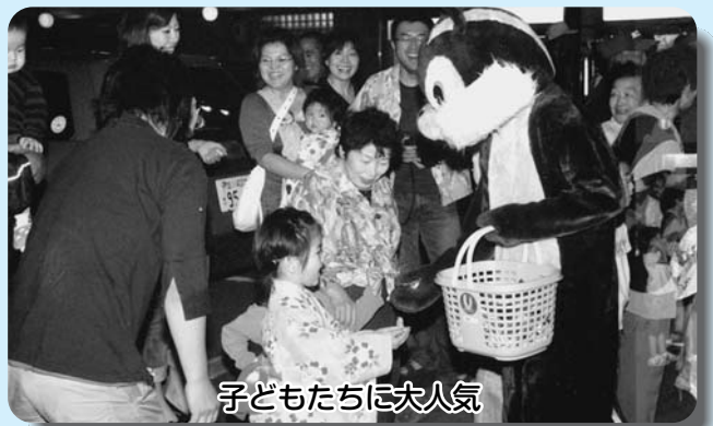
子どもたちに大人気