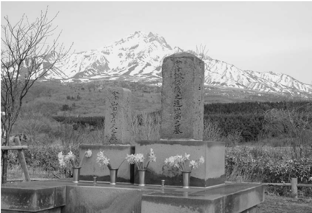
新潟県にある真珠岩と呼ばれている安山岩で造られた会津藩士の墓