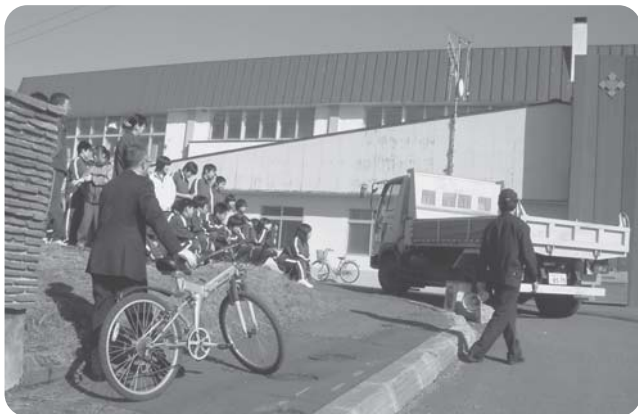
沓形中学校交通安全教室 4/10

自転車の正しい乗り方や横断歩道の渡り方などの交通ルールや、車の死角や大型車の内輪差による巻き込みなど、事故に遭わないよう、警察官の指導のもと真剣なまなざしで学んでいました。