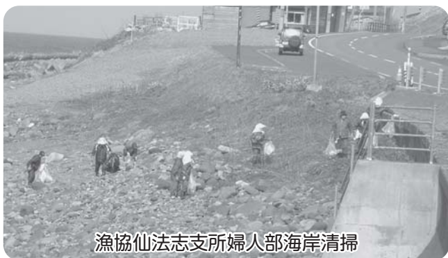
漁協仙法志支所婦人部海岸清掃

清潔で住みよいきれいな町にしようと、栄浜から御崎までの道路沿いや公園、海岸に打ち揚げられたゴミの回収を、小中学校、漁業協同組合、建設協会・観光協会加盟の各事業所などが、それぞれ実施し、ゴミのないきれいな町になりました。