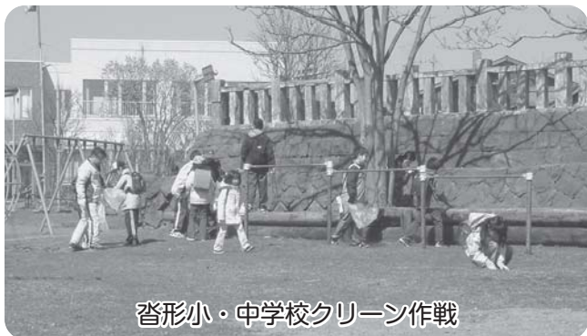
沓形小・中学校クリーン作戦