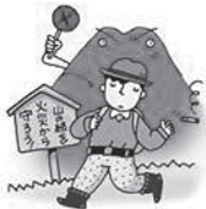
タバコのポイ捨てが…

これからの季節は空気が乾燥し、火災の発生しやすい日が続きます。山に入り、山菜採りなどに向かう人もいますが、入林した際は、タバコなど火の取り扱いには十分に注意しましょう。