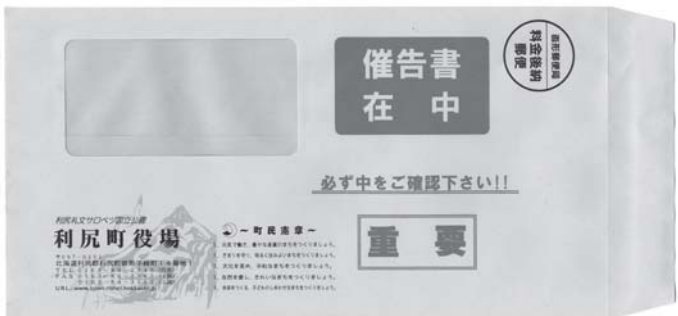
※滞納者には専用の封筒で催告書を送付している。