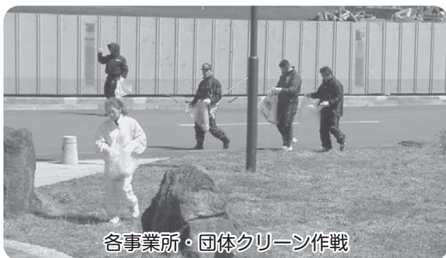
各事業所・団体クリーン作戦