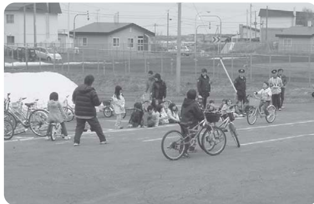
沓形小学校交通安全教室 4/15