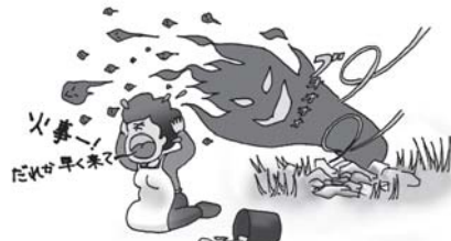
こんなことにならないように!