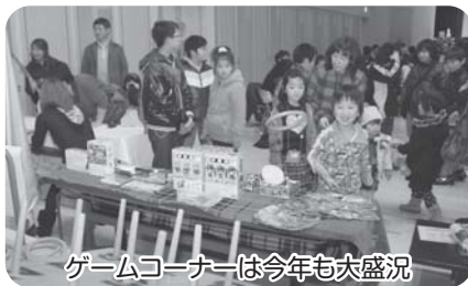
ゲームコーナーは今年も大盛況