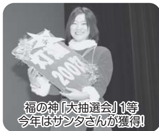
福の神「大抽選会」1等今年はサンタさんが獲得!