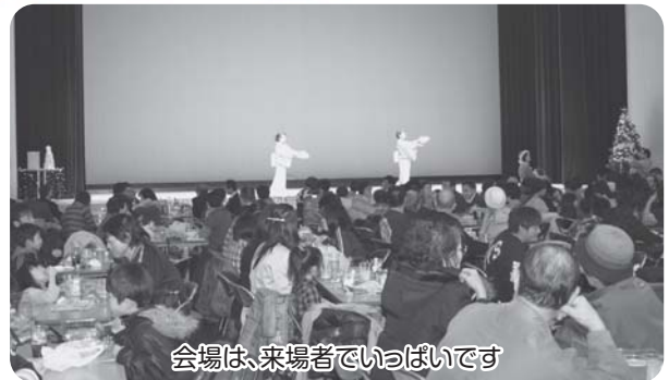
会場は、来場者でいっぱいです