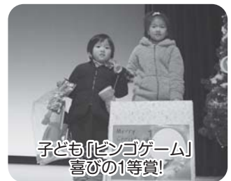
子ども「ピンゴゲーム」喜びの1等賞!