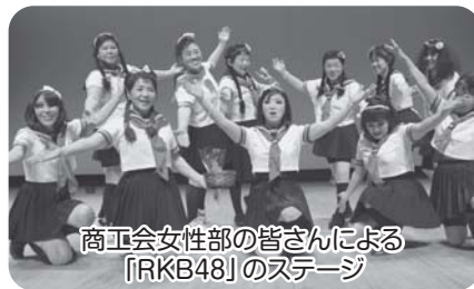
商工会女性部の皆さんによる「RKB48」のステージ