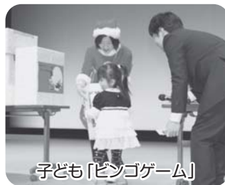
子ども「ピンゴゲーム」