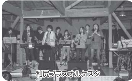
利尻プラスオルケスタ