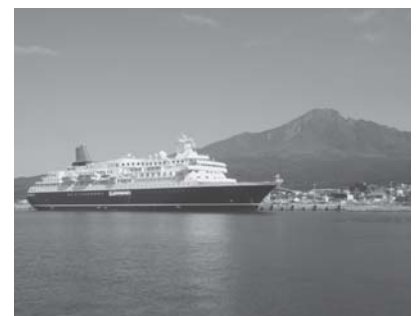
大型クルーズ船の沓形港寄港は、本年13回を予定

観光では、観光客の入り込みの増加を図るため、心温かい「もてなし」の観光地づくりを根幹とし、宗谷広域圏観光宣伝と誘致対策、昨年は七回寄港しておりますが、