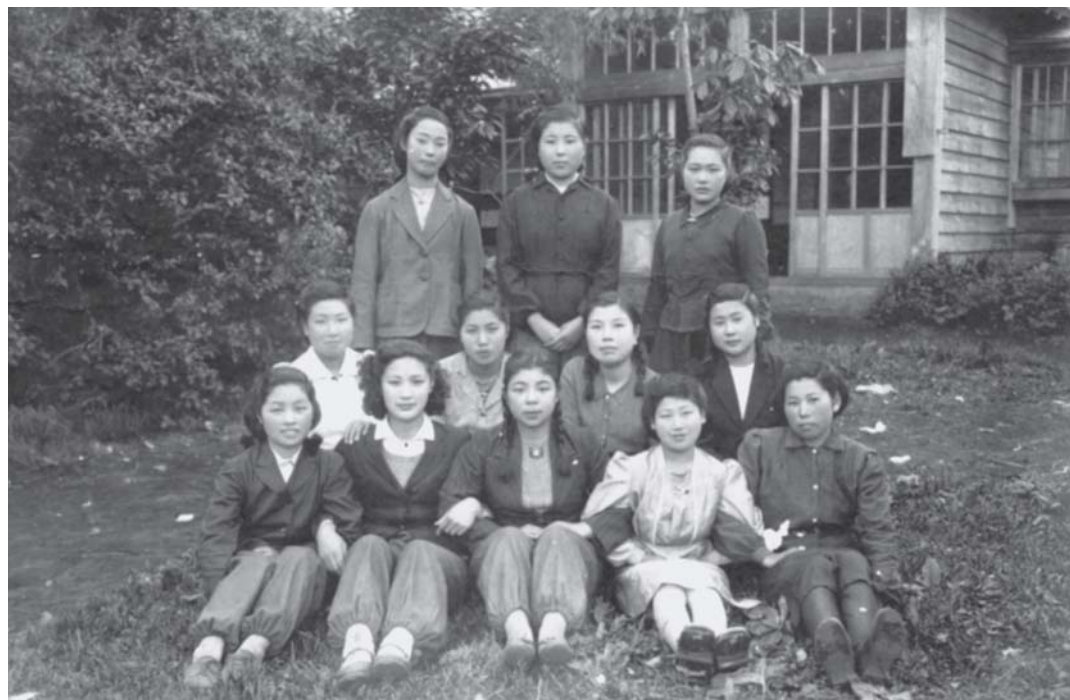
仙法志神社祭典で集まった同級生 昭和22年6月22日

小学校を卒業して社会に出 て若い女の人たちの楽しみで もあったのは冬の裁縫でした。 着物を縫えること、洗い物が できること、古い布を使って 着る物や生活に使う物に再利 用できることなど、お嫁に行 ったら、こなさなければなら ない大事な役割だったから、 どこの家の母親も和裁を習い なさいと娘さんたちに言っ たの。だから和裁で集まり習 い事が終わると、お茶を飲み ながら話をするのが楽しい 時でした。こうしたなかで今 でも覚えているのが二月八日 の針供養。いたんでいた針を 豆腐に刺して果物やお菓子を 添えて御礼を込めて海に流す の。八〇歳になって六三年前 の若い時の写真を見ると母親 の家業や家事、一年の節目の