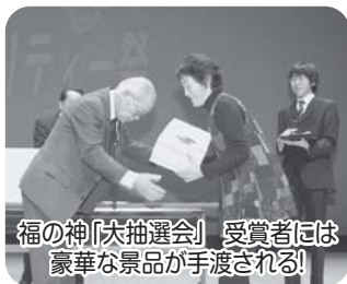
福の神「大抽選会」受賞者には豪華な景品が手渡される!