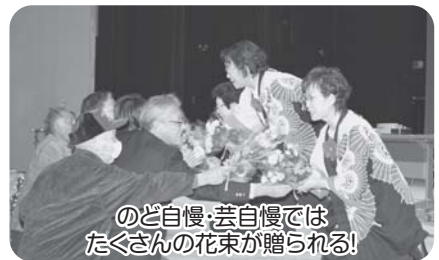
のど自慢・芸自慢ではたくさんの花束が贈られる!