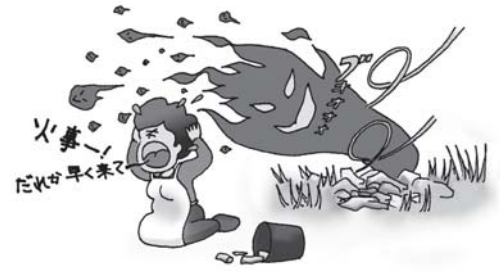
こんな事にならないように!