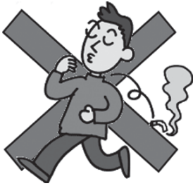
タバコのポイ捨てが…

これからの季節は空気が乾燥し、火災の発生しやすい日が続きます。 山に入り、山菜採りなどに向かう人もいますが、入林した際は、タバコなど火の取り扱いには十分に注意しましょう。