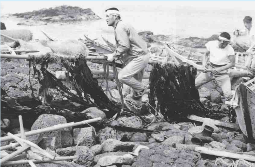
利尻昆布養殖の始まり作業 杵形漁業協同組合栄浜青年部 昭和42年(1967年)7月20日