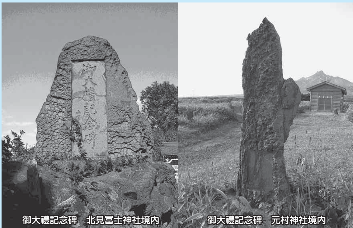
御大禮記念碑 北見富士神社境内