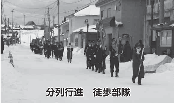
分列行進 徒歩部隊

利尻町消防団の出初式は1月7日、仙法志地区を会場に来賓30名を迎え、団員75名、少年消防クラブ員14名が参加し厳粛に挙行されました。