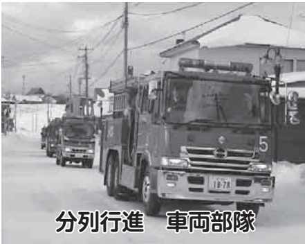
分列行進 車両部隊

利尻町公民館で行われた式典では、来賓の皆様よりお祝いの言葉を頂き、また、長年消防活動に尽力された多くの団員に表彰状が手渡されました。