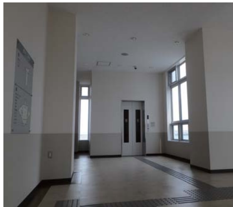
▲2階待合ホールとエレベーター