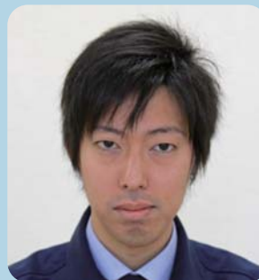
え さし か たか まさ 江刺家 堂 真さん