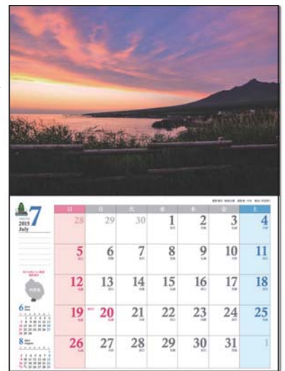
※上記の画像は出来上がり イメージです。