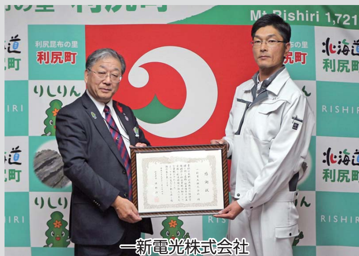
一新電光株式会社