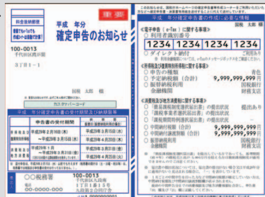
※「確定申告のお知らせ」ハガキのイメージです

このハガキ及び通知書には青色・白色申告の種類や消費税の申告に関すること、また納付税額の確定に必要な予定納税の額など、確定申告に必要な情報が記載されておりますので、お手元に届いた方は、忘れずに必ず申告会場へ持参願います。