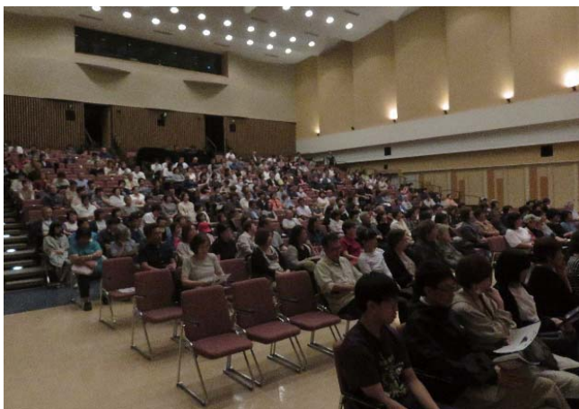
開演前の会場のようす 大盛況です!

当日は、300人以上の方が観劇され、会場は大盛況となりました。劇団四季のキャストの皆さんによるお見送りの際には、たくさんの笑顔が見られ、「とても良かった。」「感動した。」などの声が多数寄せられました。