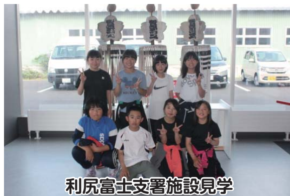
利尻富士支署施設見学