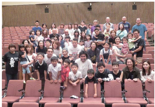
公演の2日前に実施した プライベートでの集合写真