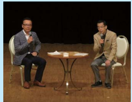
アンカートークのようす

また、9月5日(木)には、島の駅にてNHK旭川放送局「道北♡LOVEラジオ」の公開録音も行いました。