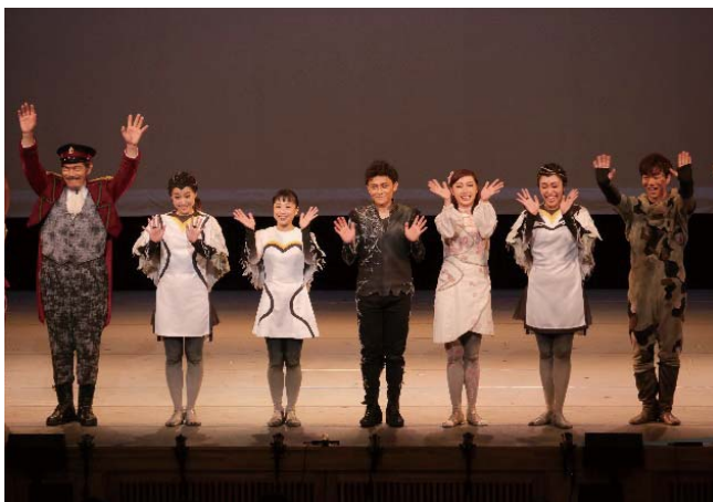
終演前のカーテンコールのようす