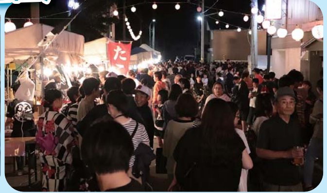
8月6日 浮島まつり(仙法志地区)