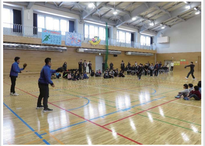
学校訪問では、質問コーナーや選手とのキャッチボールなど、たくさん交流できました!