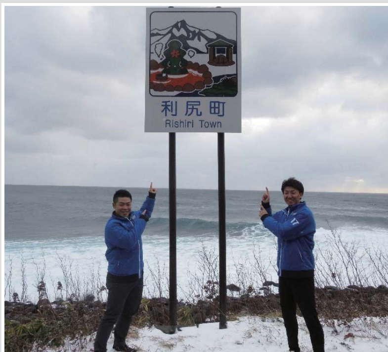
短い時間でしたが、利尻を楽しんでいただきました☆