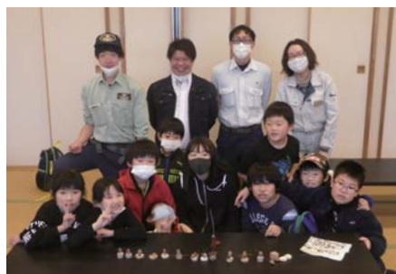
木工体験後に集合写真