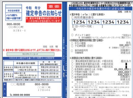
※「確定申告のお知らせ」ハガキのイメージです

3年前より、確定申告書の送付が無くなり、代わりに「確定申告のお知らせ」というハガキまたは通知書が送付されることになりました。このハガキ及び通知書には青色・白色申告の種類や消費税の申告に関すること、また納付税額の確定に必要な予定納税の額など、確定申告に必要な情報が記載されておりますので、お手元に届いた方は、忘れずに必ず申告会場へ持参願います。