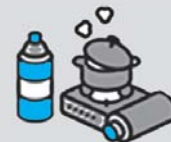
カセットコンロ・ボンベ