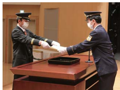
表彰状伝達及び授与